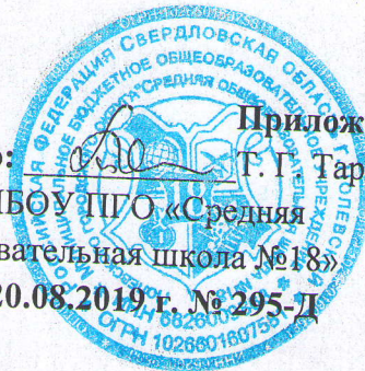
График проверок библиотечного фонда