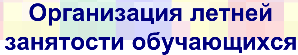
График приема документов на летнюю смену лагеря “Юность”